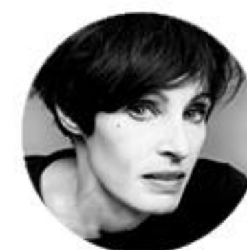
Marie-Claude Pietragalla Choreograf i gwiazda Opery Narodowej w Paryżu