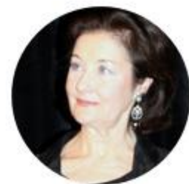
Noëlla Pontois Gwiazda Opery Narodowej w Paryżu